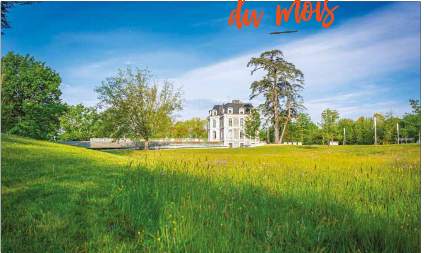
Exemple de tonte différenciée au parc du Bilàà.